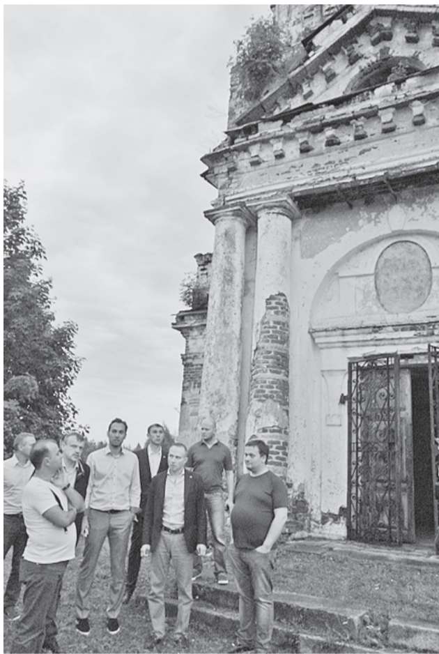
Гости из Москвы и Великого Новгорода у храма Живоначальной Троицы в Сопинах

Сейчас храм стремительно разрушается, и мы можем потерять последнее «детище Суворова», реальную, осязаемую память о нём. В 1991 году был создан трёхтомный проект реставрации храма, который так и не был реализован. Он хранится в Управлении государственной охраны культурного наследия Новгородской области и нуждается в актуализации. На реставрацию требуется несколько десятков миллионов рублей. Несколько лет назад инициативные жи-