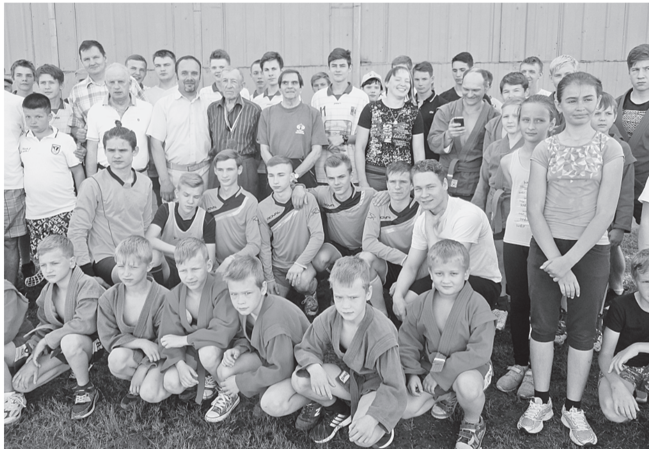
Участники спортивного праздника